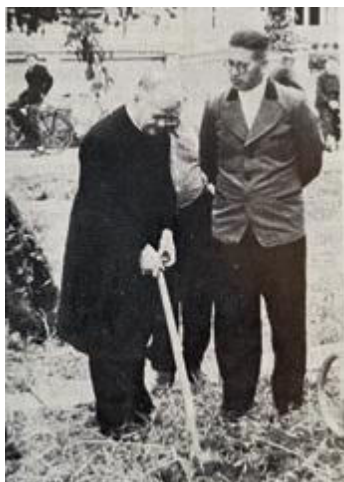
Erster Spatenstich in Heidelberg-Kirchheim im Jahr 1950

Die Baugenossenschaft Familienheim Heidelberg eG stellt dem Wohnungsmarkt im Rhein-Neckar-Kreis attraktive Mietwohnungen zu bezahlbaren Preisen in einem nach wie vor angespannten Wohnungsmarkt zur Verfügung.