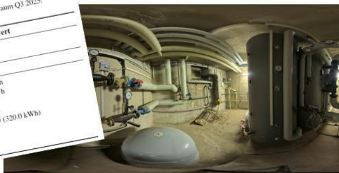
Abbildung 19: Panoramaansicht des Heizungssystems