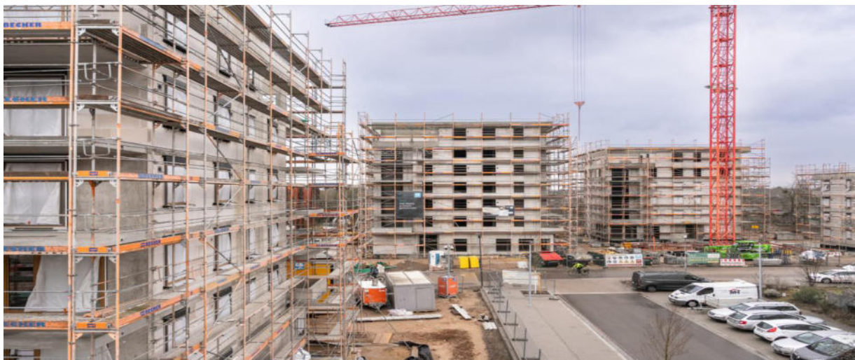
MTV-West: 122 Neubauwohnungen in acht neuen Gebäuden (Foto: GGH/Christian Buck).

Als Miteigentümer und Geschäftsbesorger der „MTV Bauen und Wohnen GmbH & Co. KG“ konnten wir in den letzten Jahren an der Gestaltung und Projektierung der Konversionsflächen in der Heidelberger Südstadt mitwirken. Entstanden sind moderne Wohnquartiere mit einem guten Bewohnermix. Junge Familien konnten ihren Traum vom eigenen Heim verwirklichen, andere Bewohner konnten ihre langersehnte Eigentumswohnung oder Mietwohnung beziehen. Derzeit befinden sich die letzten Bauabschnitte „West und Süd“ in der Planung bzw. Umsetzung.