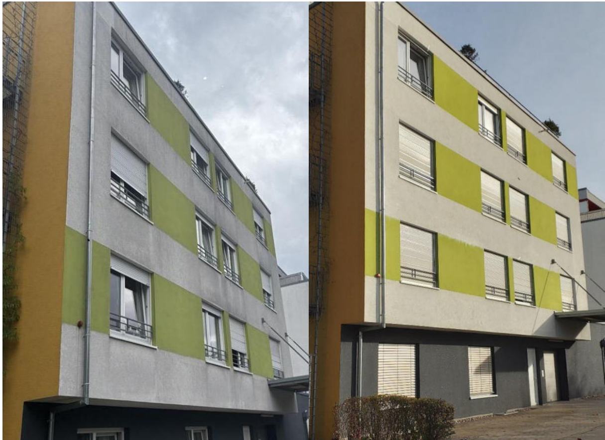
Fassadenreinigung Objekt Kranichgarten 51/1 durch die Firma Algenmax Deutschland GmbH (vorher/nachher)

Für Instandhaltungs- und Modernisierungsmaßnahmen hat unsere Genossenschaft im Jahr 2025 rund 1.852 T€ ausgegeben. Die Mittel für Instandhaltungsaufwendungen wurden insbesondere in die Wohnraummodernisierung und in die Ausstattung der Wohnungen investiert. Für das Jahr 2026 sind bestandserhaltende Investitionen in Höhe von rund 2,0 Mio.€ vorgesehen.